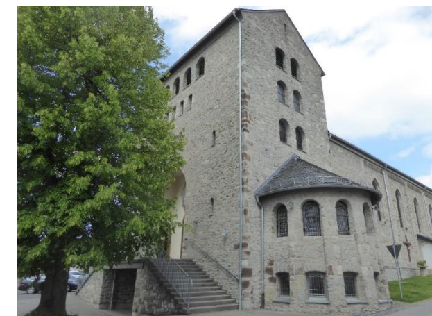
Katholische Kirche Ruppach Goldhausen St. Johannes der Täufer